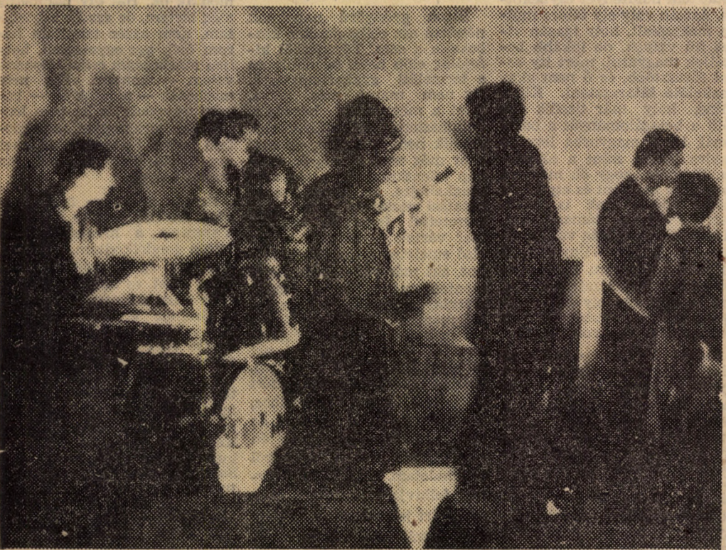
Szombat és vasárnap este hangulatos (és olcsó) közgazdász-„lokáll” változik a klub