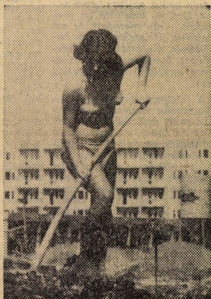
„Vajon miért fogy olyan sok fizemanyag?...”