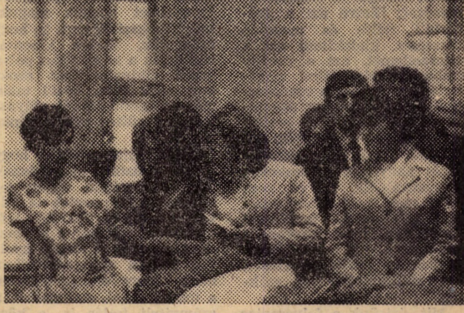
...majd miután mindenki átveszi az ágyneműt...