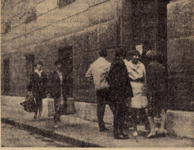
Nehéz bőröndökkel érkeznek meg a Makarenkó utcai kollégium lakói...