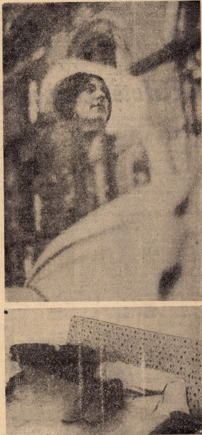
„Abszolút kényelemben” a klubban