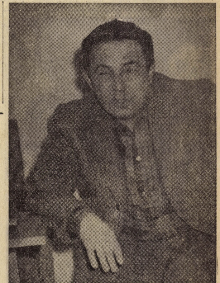
— Nem vagyunk mi olyan gyengék...