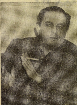
— Hagyjuk a focit!