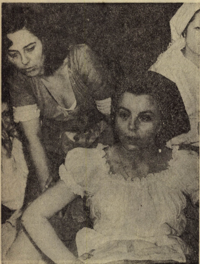
Irodalmi Színpadunk „javuló formában” készül a hó végi szegedi országos versenyre