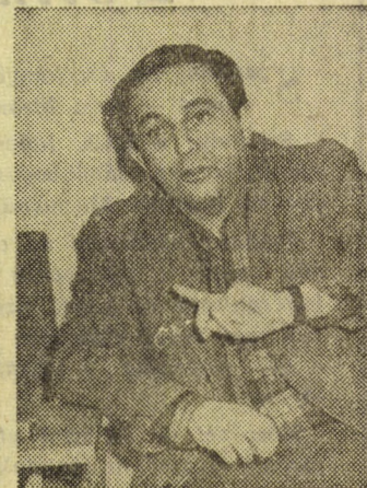
— Persze, ha meggondoljuk...