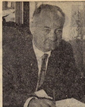
... Van, aki sohasem öregszik