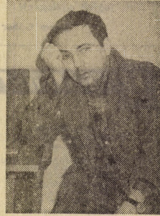
— És elemezzük a helyzetet!...