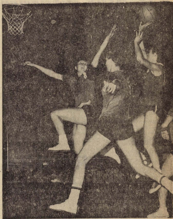
Riportunk a 6. oldalon