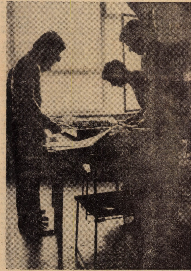
Pihenőben gombfoci...

„Meg kell valósítani a kibernetikus gondolkodást, akár mérnökökről, akár közgazdászokról van szó. Rendszerekben kell gondolkodni ahhoz, hogy átfogó képet kapjunk. Jelenleg 30 műszaki részesül mérnök-közgazdász képzésben.”