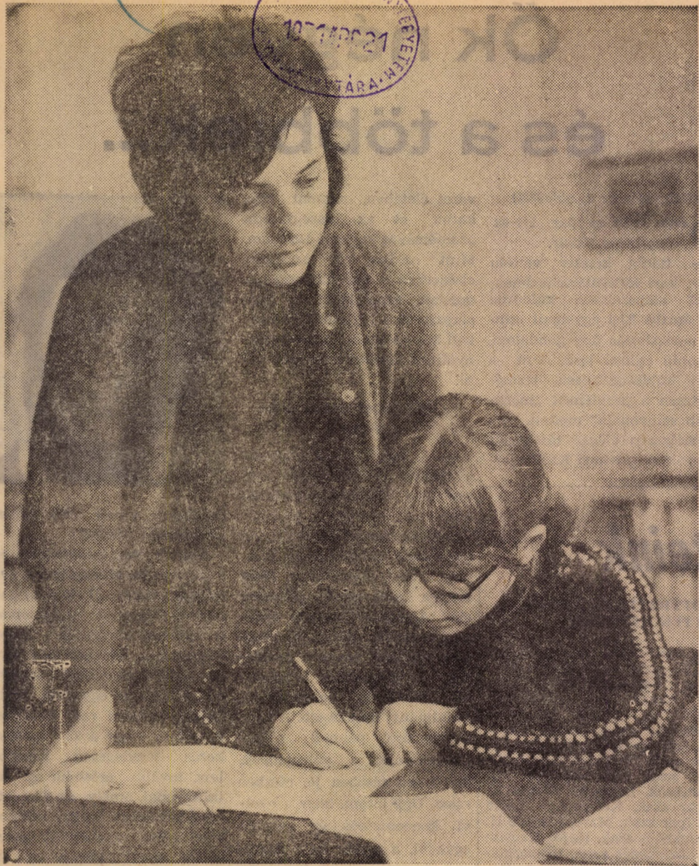
„Csak pontosan, szépen...” A Studium Generáléről szóló cikkünk a 3. oldalon