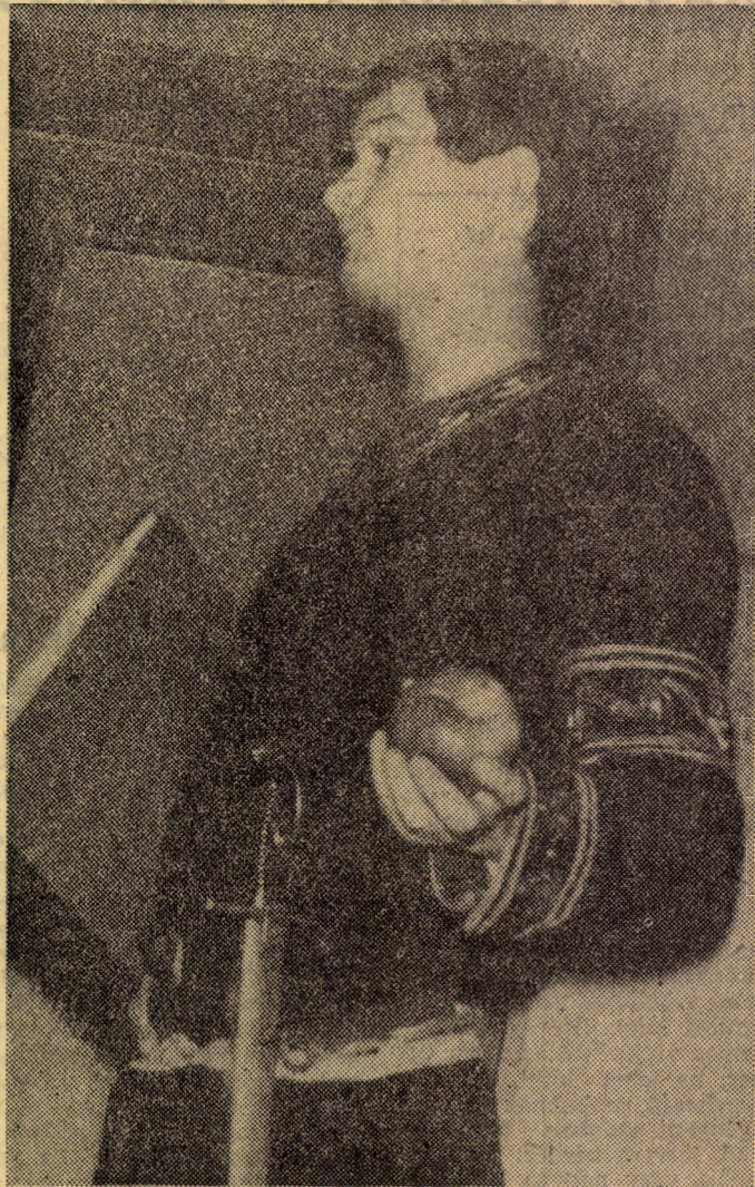
„Maguknál lesz tudományos feudalizmus szeminárium?”