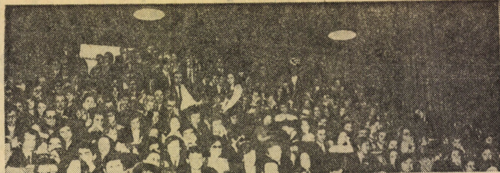
Röhög az osztály

Próbáljuk ki — hátha jobb mindkettőnknek. (domány)