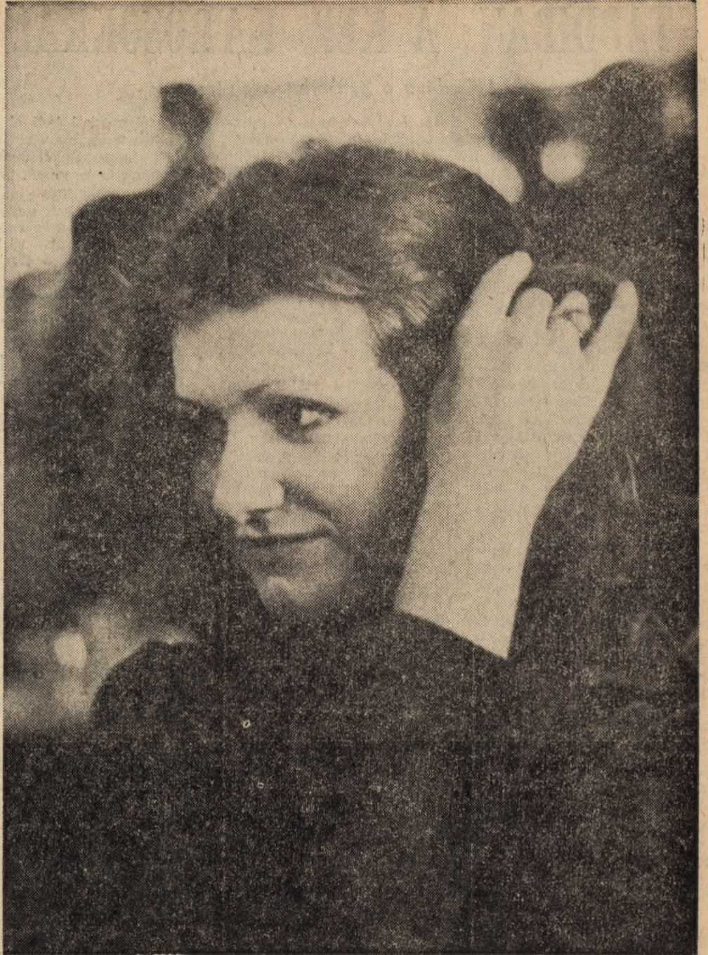
Újra itt a tavasz