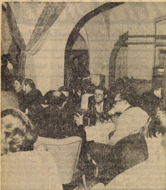
Élénk vita alakult ki a diákok és a tanárok között

Az egyre biztatóbbnak mutató törekvés, hogy piros betűs ünnepeinket a hagyományos megemlékezéseknél kevésbé megszokott módon avassuk a dátumhoz méltó eseményé, ismét egy új kezdeményezéssel gazdagodott.