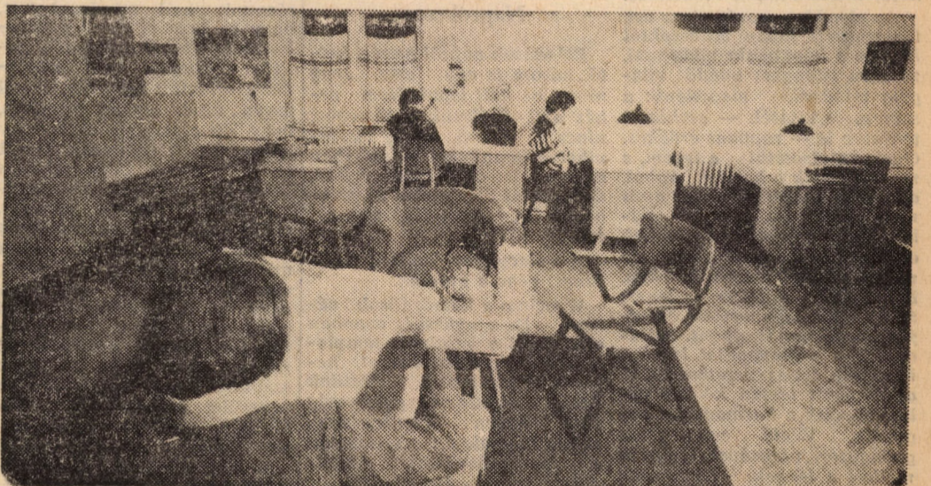
A szakkollégiumi munka sok időt köt le

— Azok a lehetőségek vonzóztak, amelyeket a szakkollégium intézményesen biztosított, például nyelvtanárak, témakoncentrált, témavezető tanár. Másrészt, sok ismerősömmön láttam, hogy az egyetemi nehézségek csökkenésével évről évre lejjebb engedték a saját mércéjüket is. Ezt akartam elkerülni a „környezetváltozás-sal”, és örülök, hogy így tettem. Az itteni légkör nélkül talán a TDK-t sem írtam volna meg.