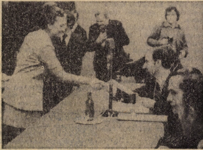
Doktoravató egyetemi tanácsülést tartottak 1974. július 14-én egyetemünkön. 120 fiatal közgazdász vette át e napon a doktori oklevelet.