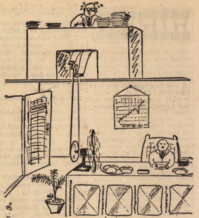
Szabó Albert rajza