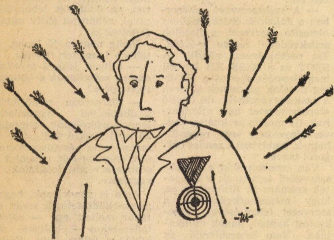
Halász Géza rajza