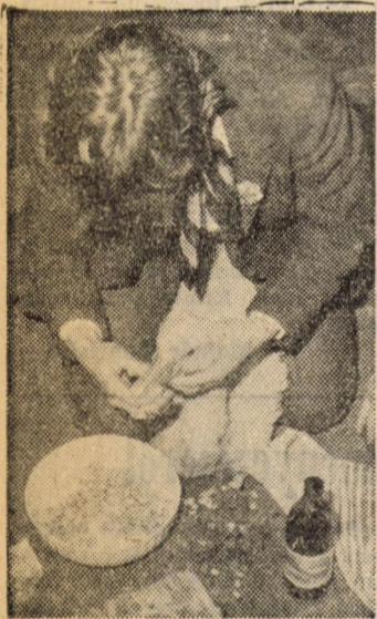
Tömk a libát