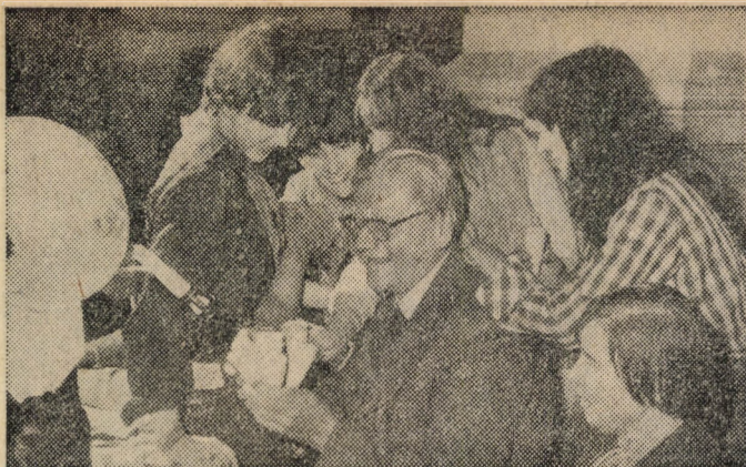
Folyik a megvesztegetés (célpont: a rektor)