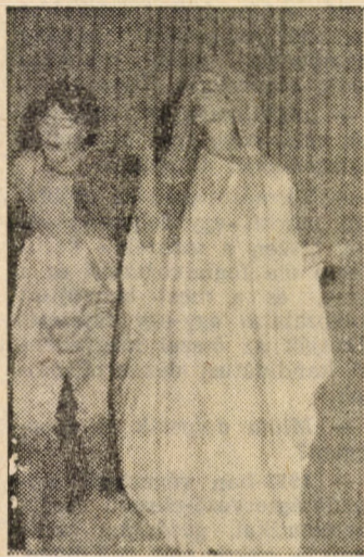
Részletek a „darabból”...