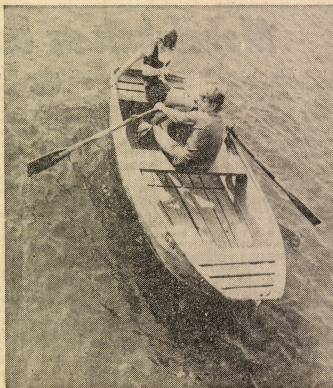
Jó lenne már révbé érni...