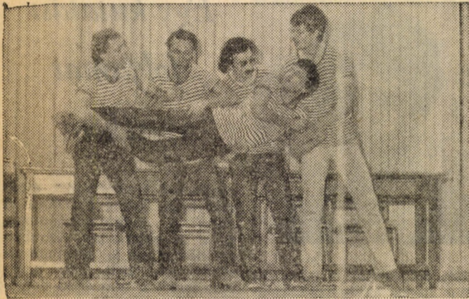
A közgazdászok musicalje