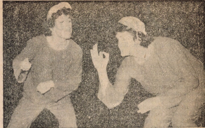
Műsoron a Karsai együttes