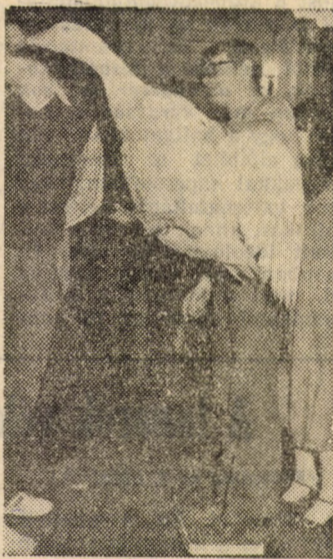
Melyik liba a nehezebb?