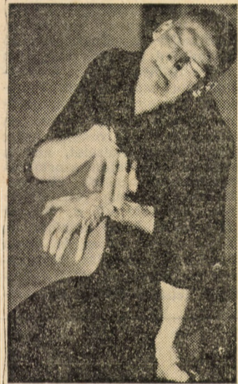
Kecskés András: Mario és a varázsló

mind a gyomrom, mind pedig egyes magasabb rendűnek mondott szervi képződményeim képtelenek és tehetetlenek bizonyultak befogadására. Az első néhány percben még csak követhető volt mondanivalója, a bibi csak az, hogy műsora mintegy óra hosszat tartott. Így aztán nem maradt más a közönség