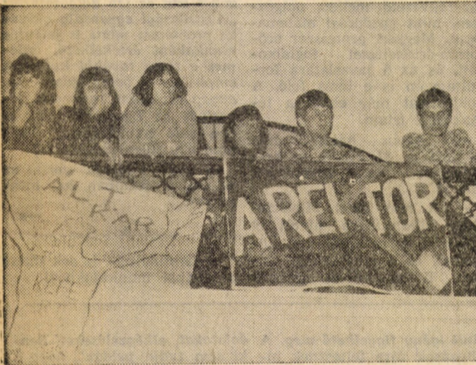
Ez még az előző nap: rektorra várva...