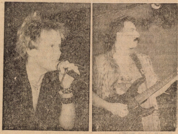
„Mielőtt végleg elmegyek, kapsz egy képet rólam” — énekelt a Bikini