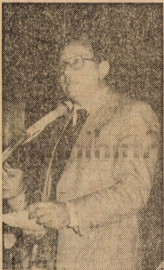
... a főiskolákkal sikerült megállapodni

— A tantervben az szerepel, hogy az új képzést lényegében változatlan oktatói létszámmal kívánják megvalósítani, amihez nyilván bizonyos kádercserére lesz szükség.