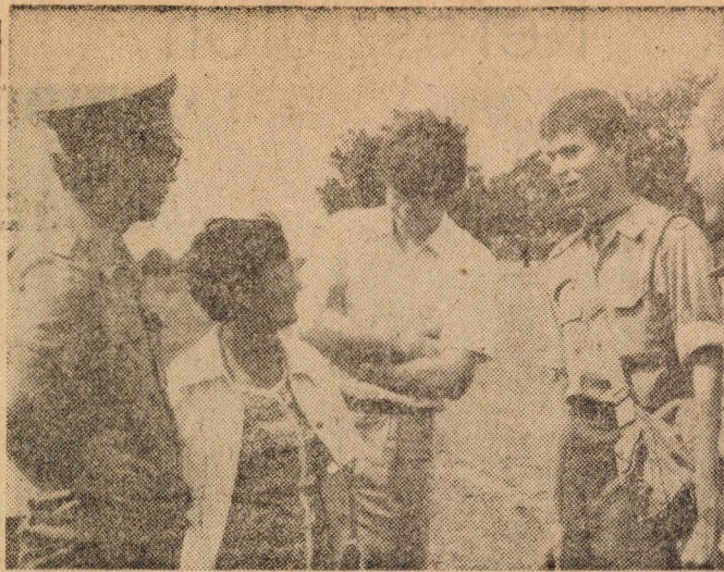
Az előfelvételis jelentést tesz a majdani „parancsnokának”