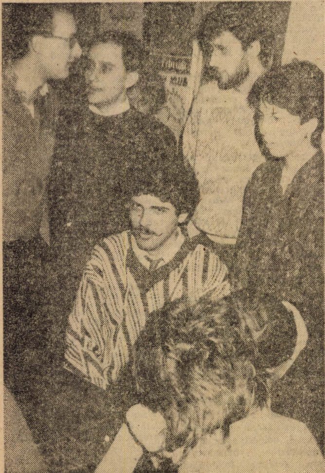
Ösztöndíj-kiegészítés(?) a kaszinóban

Szeretnénk minden kedves érdeklődő figyelmébe ajánlani két tábort, amelyek elsősorban instruktoroknak készülnek, illetve azoknak, akik instruktorok akarnak lenni, de minden kedves érdeklődőt szívesen fogadunk. A tábortok részletes programja még ismeretlen, de — az elmaradhatatlan vidámkodás mellett — szó lesz az instruktori munka rejelméről, jövőjéről is. Időpont és helyszín: április 17—19. Tata és május 8—9. Csillebérc. Közelebbi információk a plakátokról!