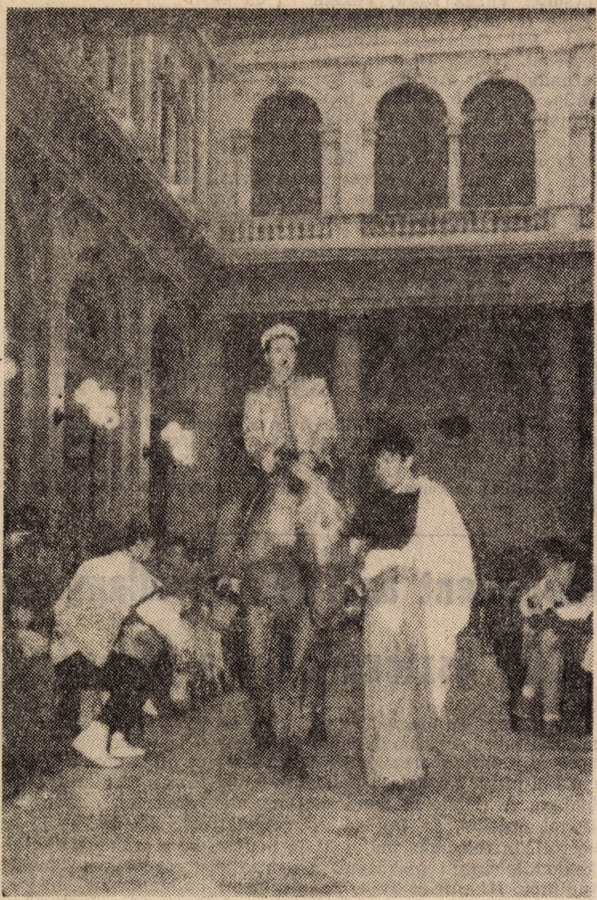
Egyetememet egy lőért

retném, ha nem süllyedne tovább a KEN színvonal. Ehhez azonban szükség van arra a társadalomra, közéleti aktivitásra, amiről a vasárnapi vetélkedő levezetője is beszélt. Vegyük észre, hogy az egyetem hallgatóinak mintegy 20-25 százaléka szavazott csak a jelöltekre. Ez az a 25 százalék, akit meg lehet mozgatni az egyetemen. Ok vesztünk részt a KEN-en, az ifjúsági parlamenten és minden