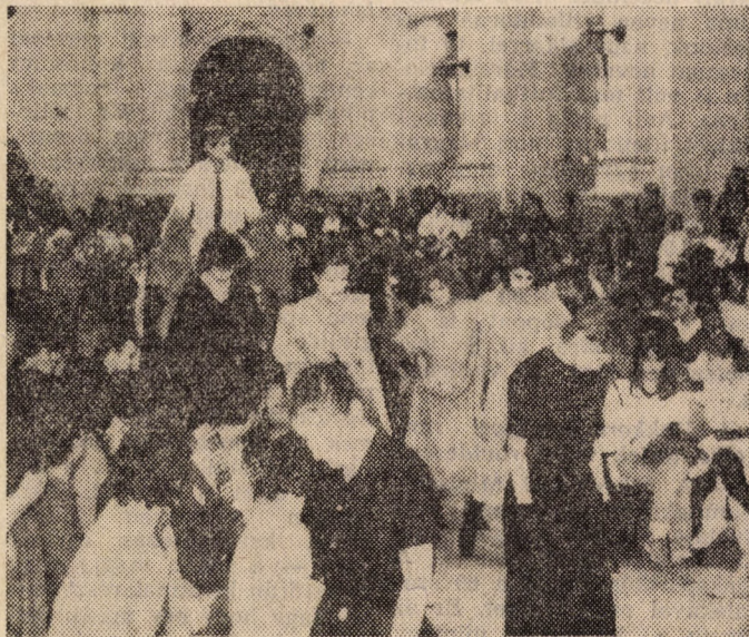
Unnepelt az aula

Am nem ez az egyetlen dolog, ami visszataszított váltott ki bennem. A KEN három rendezvénye (Kend mit tud, sport, vasárnapi vetélkedő) közül csak a „Kend mit tud”-ról jelent meg a plakát, azonban ennek a 2-3 írománynak felhívó jellege nem volt. A héten a tájékoztatás a nullával volt egyenlő. A KISZ Bizalmasban, ami pénteken jelent meg, ugyan benne voltak az időpontok, de ezt kb. már egy héttel előbb kellett volna megjelentetni. Ráadásul a sport kezdési időpontja rosszul volt benne. Ezért alakulhatott ki olyan