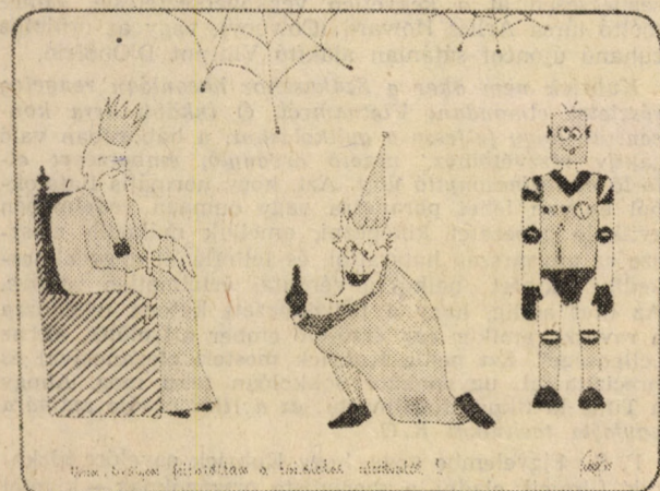
Wavrik Gábor rajza