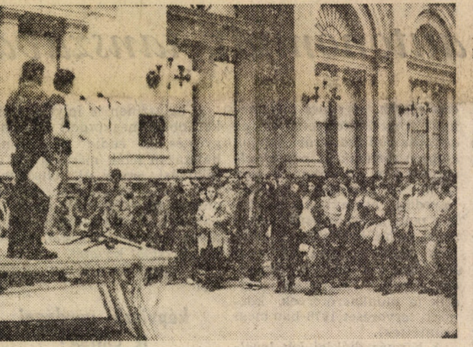
A levelet az Országgyűlésnek címezték.

A szeptemberi szegedi bölcsészkar sztrájk újabb hullámként november 23-án és 24-én összehangolt megmozdulások voltak az ország egyetemén, főiskoláin Debrecen-től Szombathelyig. Az ok nemcsak a szegediekkel való szolidaritás demonstrálásának szándéka volt, hanem az is, hogy a figyelmeltető akciók rádobbantak végre a kormányt és az ország vezetőit: a felsőoktatás helyzete kritikussá vált, és az egyetemek nem tűrik tovább a tilli-tólit.