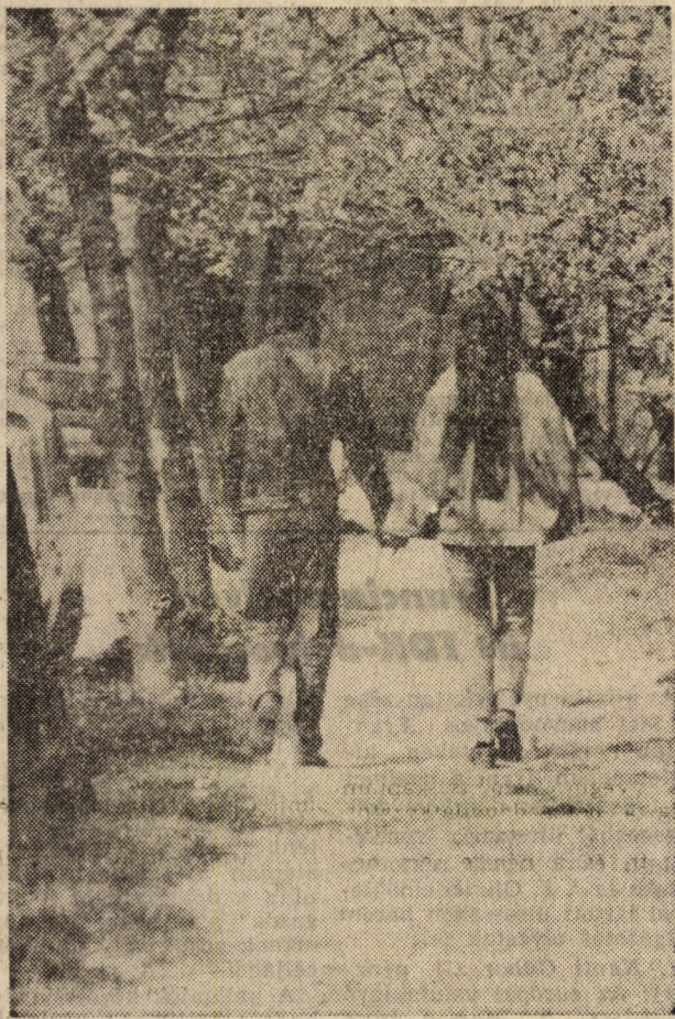
Rózsa Gábor képe