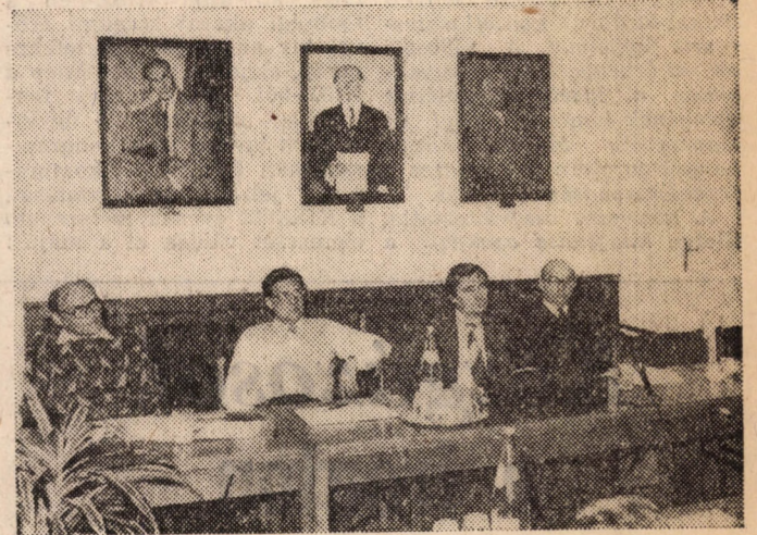
A tanácskozás résztvevői

lyekből egyszerűbb volt vizsgálni. Vendégprofesszoraink azt tanácsolták, hogy egyetemünk vezetése még egyszer tekintse át a választható tantárgyak körét, bizonyos szakokon pedig több kötelező tantárgyat írjon elő. Jelezték azt is, hogy a tanár-tanácsadónak — akik a diákok egyéni tanterveit jóváhagyják — nagyon oda kell figyelniük arra, ne hogy a közgázon is a nyugat-európai gyakorlathoz hasonló tendencia menjen végbe.