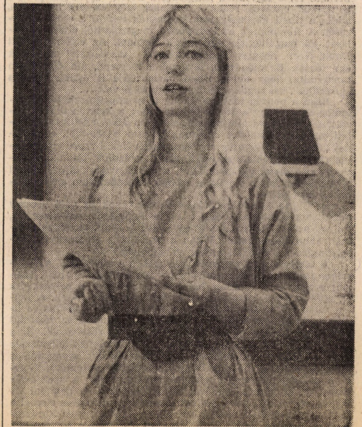
Érdemes TDK-konferenciára menni!

A Marx Károly Közgazdaságtudományi Egyetem lapja. Felolós szerkesztő: HALAV EDIT Szerkesztőség: Budapest IX., Dimitrov tér 8. 1093. Telefon: 174-548. Kiadja a Hirlapkiadó Vállalat, Budapest VIII., Blaha Lujza tér 3. Felolós kiadó: VÁGNER FERENC vezérigazgató 89—4227. Szikra Lapnyomda, Budapest Felolós vezető: CSÜNDÉS ZOLTÁN vezérigazgató