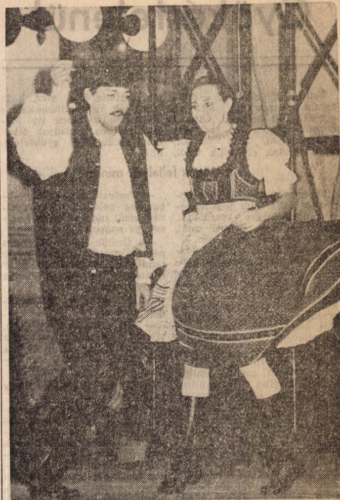
„Rámás csizmát visel a babám...”