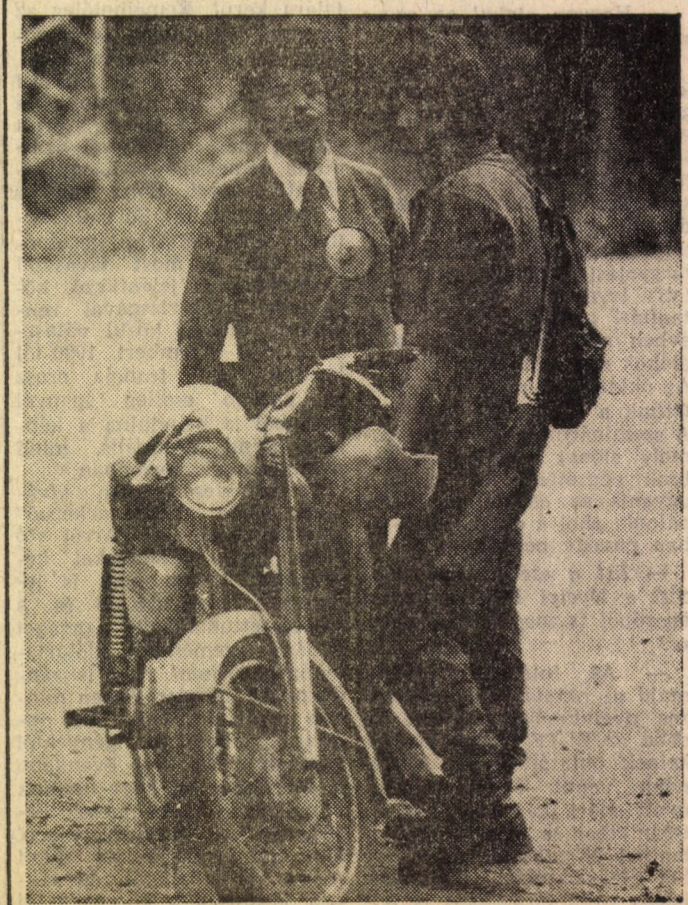
Ez elment vadászni...