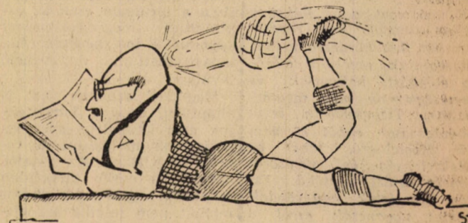
A modern szfinx (Szatmári Miklós rajza)