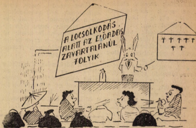
Meglepő tábla (Szatmári Miklós rajza)