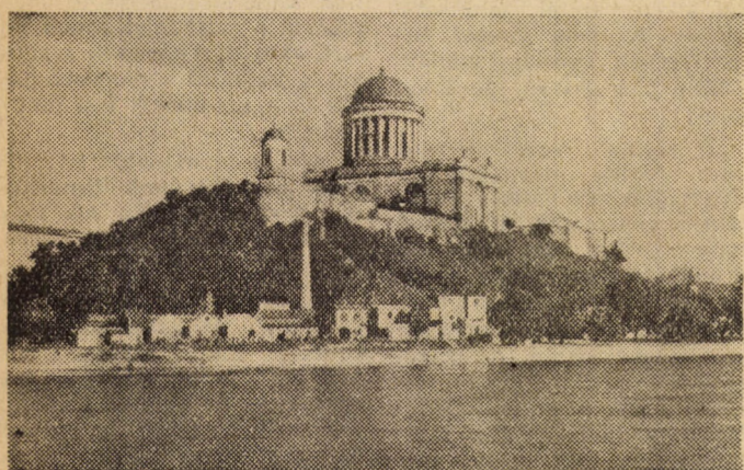
Hallgatóink a tavaszi szünetben kirándultak Esztergomba, onnan küldték üdvözlőlevelüket

S ugyan a „hagyományos kulturális érzéketlenség” ilyen gyors eltűnését mivel indokolni az említett folyóirat, ha egy röpke pillantást vetne a könyvkérdés mai helyzetére? Feltehetően kénytelen lenne felismerni, hogy a mi társadalmi rendszerünkben a dolgozók szellemi szükségletét nem az üzleti szervezetek profithajászó tevékenysége, vagy az ügynökrendszer áldatlan működése irányítja, hanem a dolgozók helyesen tudatosított ízlésének, igényének és anyagi helyzetének valódi felmérése.