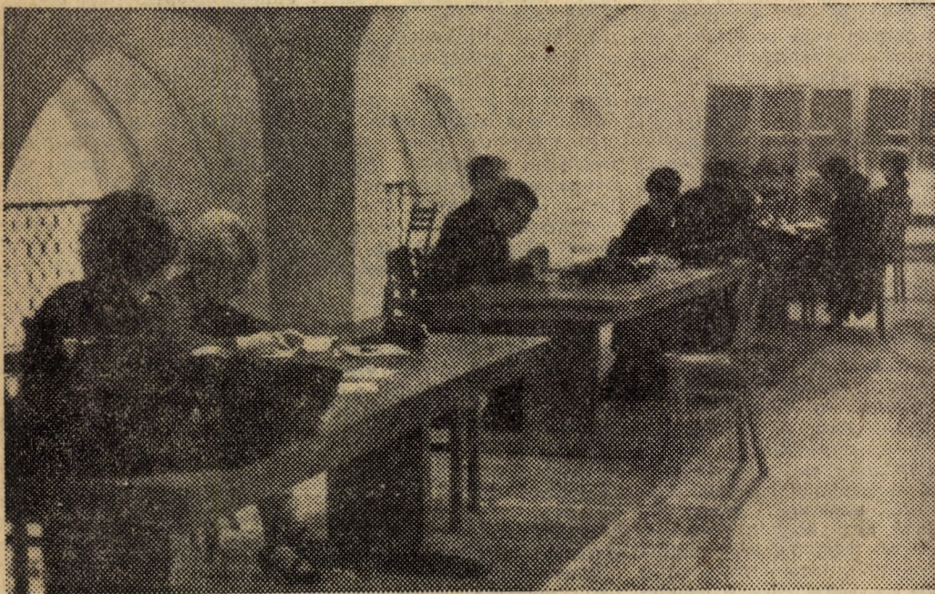
Kitűnő ötlet volt az aula feletti galériát tanuló társalgónak berendezni. Így remélhetőleg nagyobb csend lesz a könyvtári olvasóteremben.