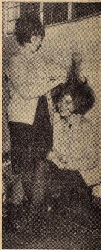
Elcsélt pillanat az aulában