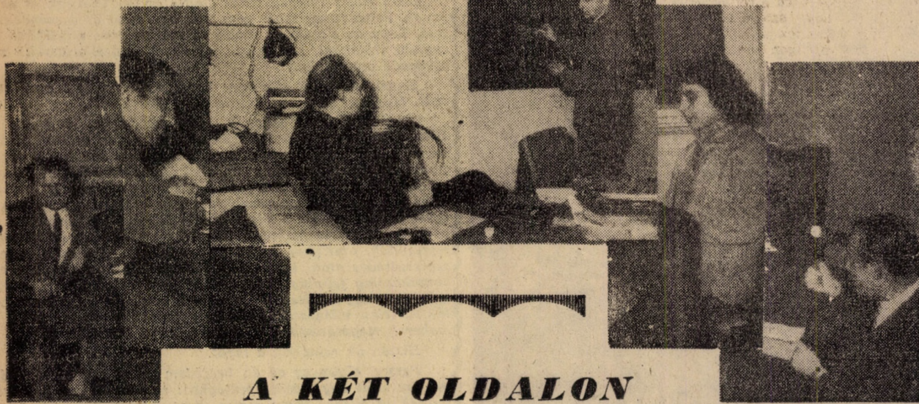
A KÉT OLDALON

Január! Vizsgaidőszak! Ilyenkor valahogy minden más az egyetemen. A folyosón, könyvtárban, sötétruhás lányok és fiúk. Mindegyik arcán izgalom, öröm, várakozás vagy elkeseredés. Igen. Ilyenkor a folyosókon és a tanszékeken zajlik az egyetlen élete. A nagy előadók üresen tátognak. A katedrákon nincs előadó, a padosok üresek. Megfordult a világ: akik a félév folyamán az előadásokat tartották, most hallgatnak, s akik hallgattak, előadnak, beszámolnak. Ez a nagy számonkérés ideje: a vizsgaidőszak. A „Közgazdász” tanulmányi rovata elhatározta, hogy végigvezeti az olvasót egy vizsgákkal túlszűfolt délelőttön. Támadás 10 órakor! Ez volt a terv. Már fél tízkor gúllekezték a riporterek a zsibongóban. Még egy utolsó megbeszélés, s utána pontosan 10 órakor a riporterek benyitnak egy vizsgára.