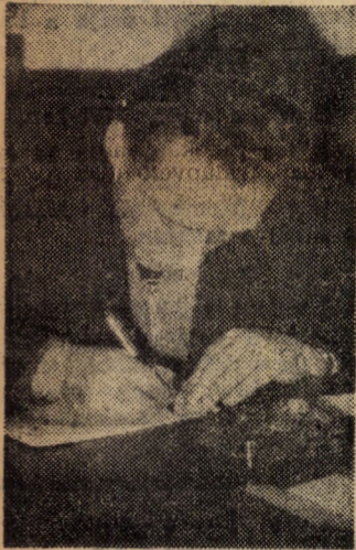
Mint a vízfolyás, úgy tudja a tételt

Ebből a tételből elég is. Jól van, látom, szépen készült. No, még egy kérdést. De jó