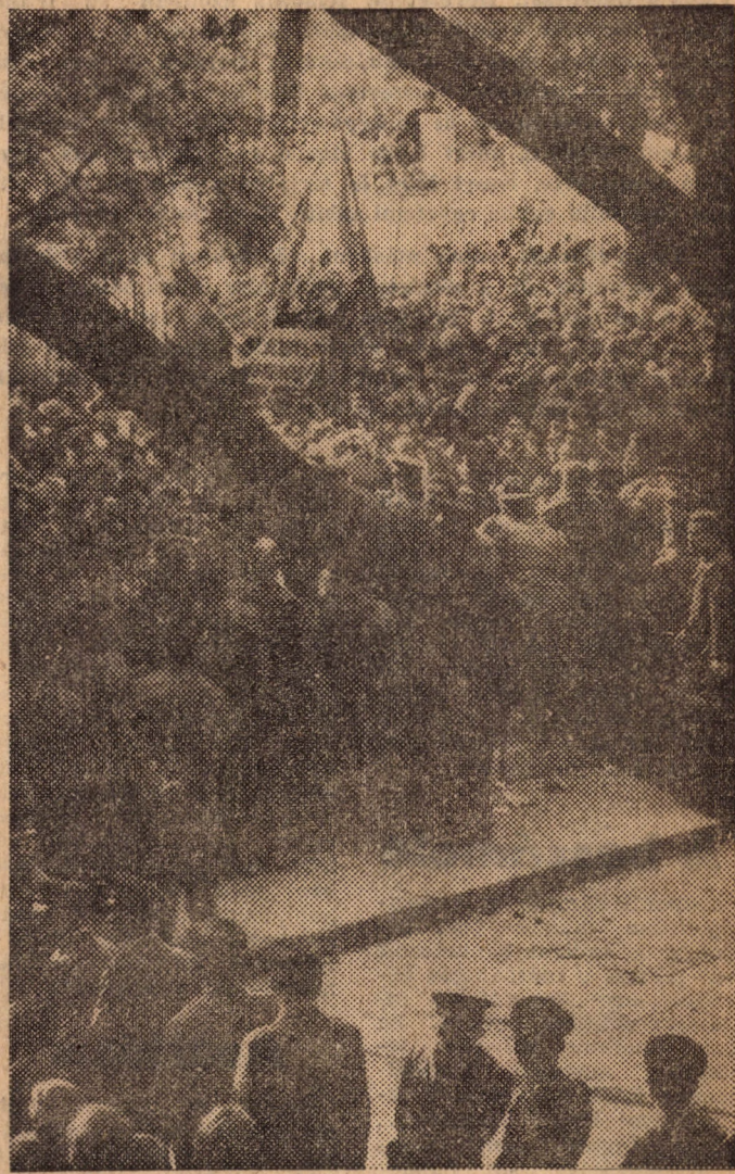
Nehéz Vietnámért teljesen „békésen” tüntetni...

Az amerikai imperialisták újabb eszkalációs lépései, a kiszélesedő vietnami agresszió ellen tiltakoztak budapesti munkás- és diáktalálók a Szabadság téren május 26-án a KISZ Budapesti Bizottsága által szervezett tüntetésen.