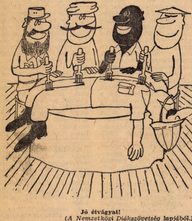
Jó étvágyait! (A Nemzetközi Diákszövetség lapjából.)