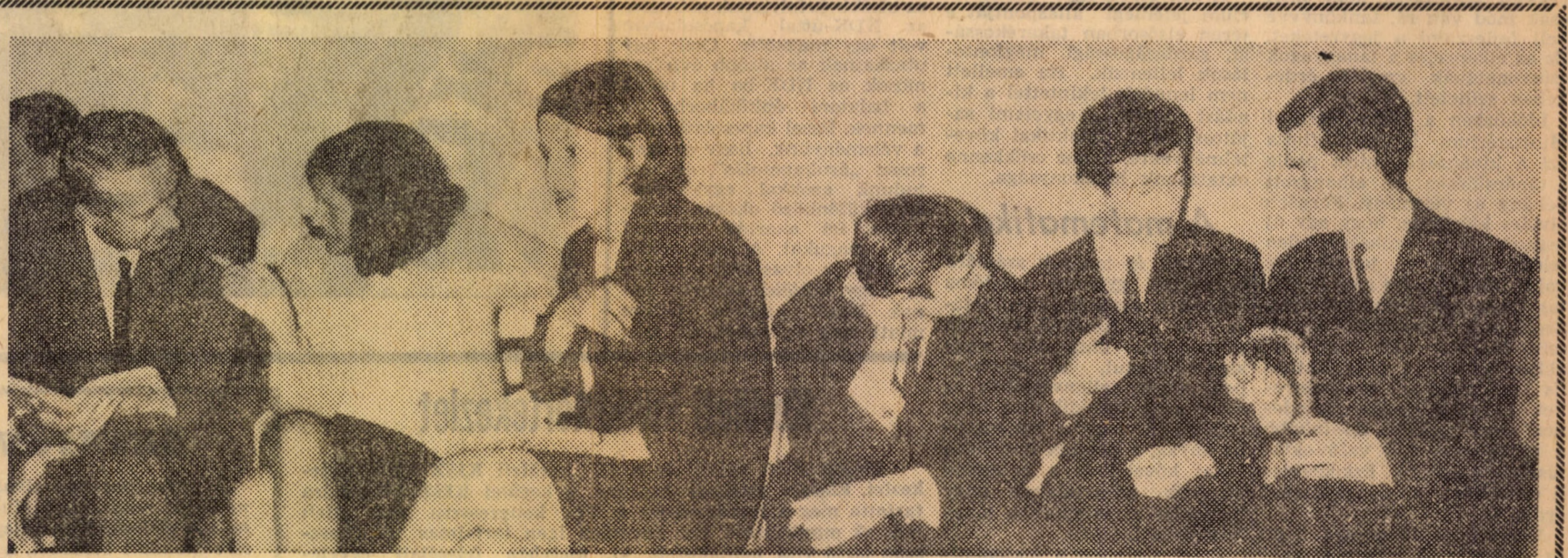
„CSENDÉLET” — AVAGY VIZSGA ELŐTTI PERCEK A FOLYOSÓN

A politikai körök jelenlegi színvonalán a párt- és a KISZ-szervezet együttes erőfeszítéseivel lehet javítani, ehhez kedvezőek az objektív feltételek. (Nem értett egyet Bauer Tamással, aki szerint a jelenlegi objektív feltételek nem teszik lehetővé, hogy a politikai