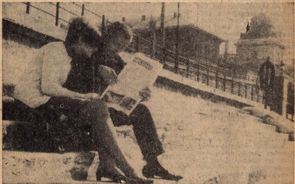
TAVASZ A LÉPCSON...

E házi versenyre április 10-ig lehet jelentkezni a nyelvi körök titkárainál vagy tanár-vezetőjénél, nagyszűnetben a 336/a szobában. Az írásbeli versenyt április 11-én délután 2 órakor, a szóbeli versenyt pedig április 12-én délután 2 órakor tartják a nyelvi tan-székben.