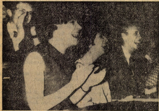
„Röhög az évfolyam” (Karinthy után szabadon), de a tréfának csöppet sem érződött „epigoni” hatása...