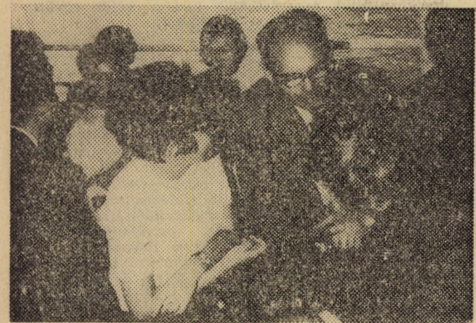
Rikics elvtárs az elsőévesekkel beszélget a sétahajó fedélzetén.