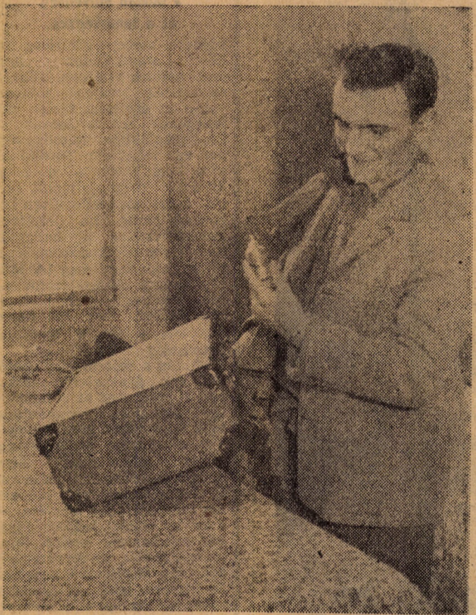
Jaj, a locsolgodom, majd itt fejejtetem...