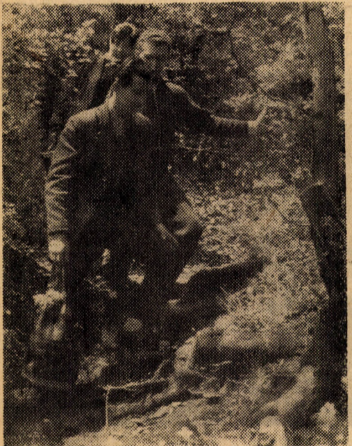
Felkerekedik és elindul a rengetegbe