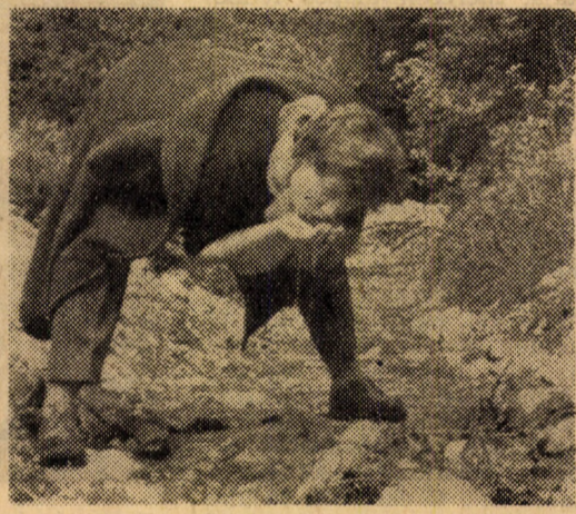
Mások megküzdöttek az akadályokkal