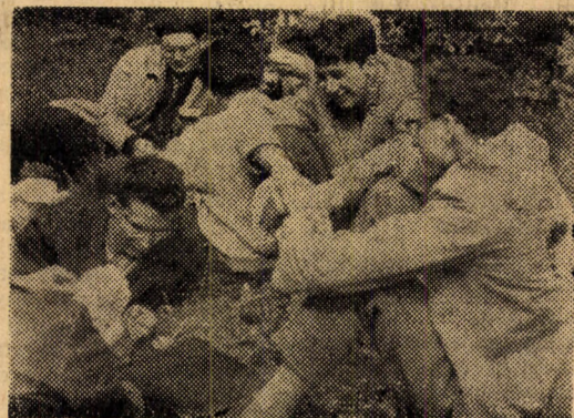
Néhányan a II. állomás hiábavaló keresgélése helyett kártyázásra adták a fejüket