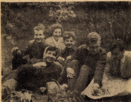
A csoport haditanácsa erősítés után...