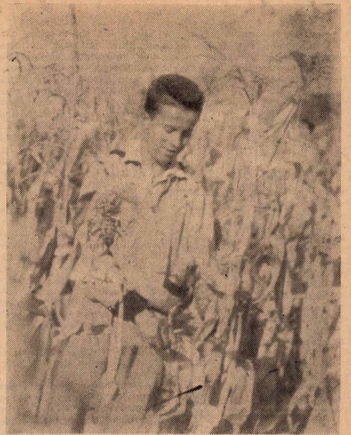
A kollégiumok hamar hozzákezdtek a társadalmi munkák szervezéséhez. Monoron mintegy kétszáz fiú és lány, a Veres Pálné utcai kollégium és a Rudas László utcai diáktanthon lakói vettek részt kukoricatörésen.