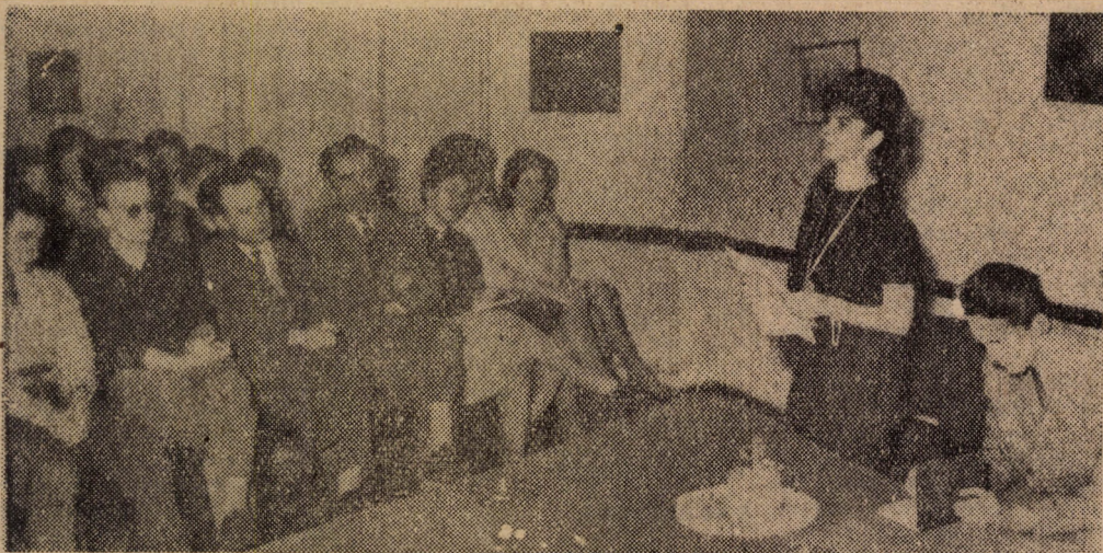
a Rudas László utcai leánydiákotthon és a Veres Pálné utcai kollégium hallgatói közösen emlékeztek meg rövid műsoros esten.