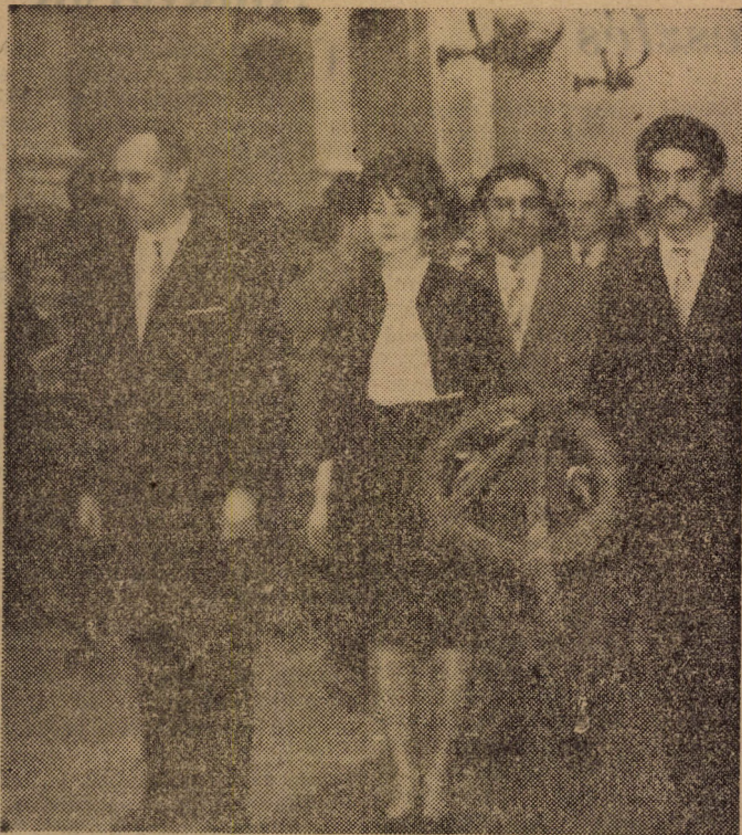
halálának 80. évfordulóján megkoszorúztuk egyetemünk névadójának szobrát.