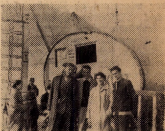
Barátkozás egy sztálinvárosi cirkuszkocsi előtt