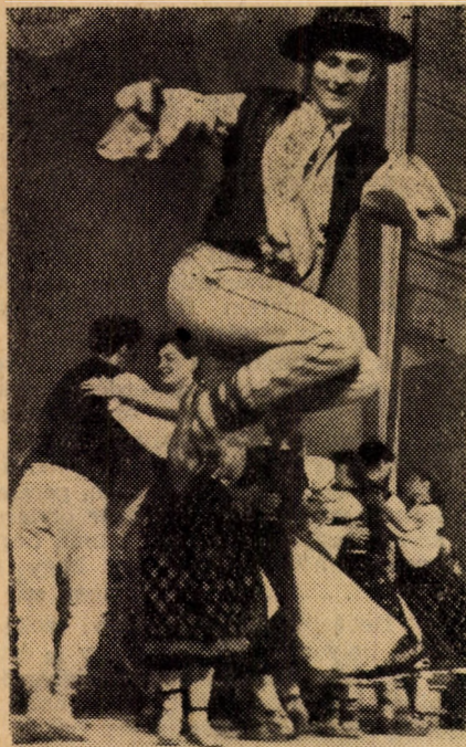
Képünk a táncgyűlés legjobb szólótáncosát ábrázolja, aki kitűnő táncával és kifejező arcjátékával igen sok sikert aratott.

Eltávoztak vendégeink, a Csehszlovák Köztársaság állami díjával kitüntetett Prágai Főiskolai Művészgyűlés tagjai. Reméljük, jól érezték magukat nálunk. Programjuk változatos volt, jártak Aquincumban, Sztálinvárosban, a Balatonnál, Budapest legszebb helyein: a Várban, a Parlamentben, a Szabadsághegyen, előadásokat tartottak Sztálinvárosban, Egyetemünkön, a Sztálin Akadémián, Csepelen és a Központi Tiszti Házban, így többé-kevésbé megismerték hazánkat. Megismertek — azt mondják — megszerettek bennünket és mi is szívünkbe zártuk őket.