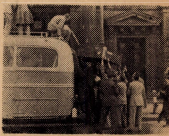
Nehezek a hangszerek