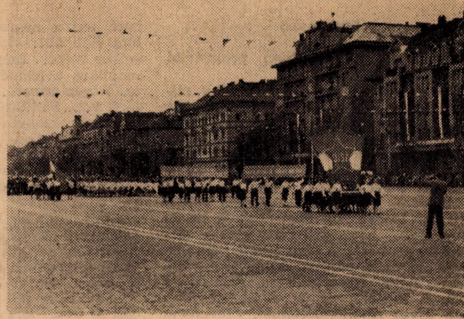
A budapesti ifjúság felvonulása