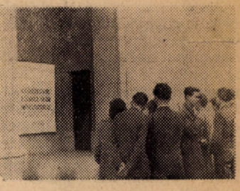
A plakát és akiket hirdet