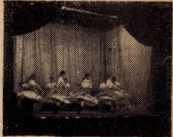
Részlet a műsorból