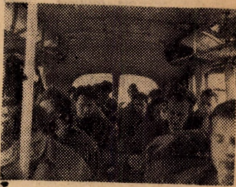
A Balaton felé