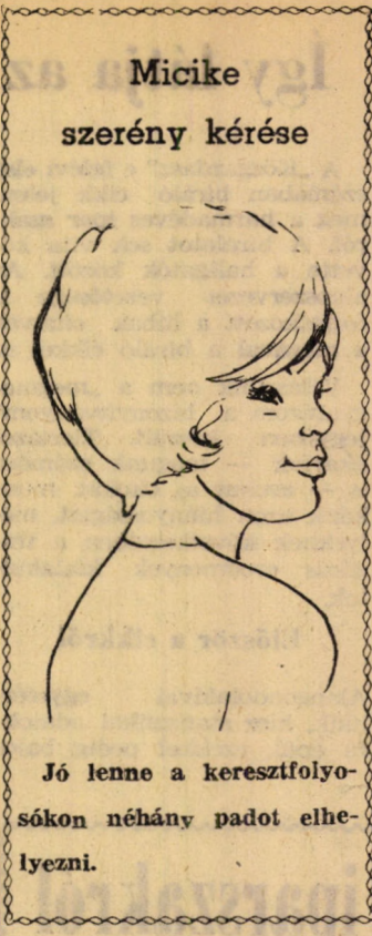
Micike szerény kérése Jó lenne a keresztfolyó-sákon néhány padot elhe-lyezni.

utolsó falatját eszegeti. Balke-zében az állandóan olvasott vastag könyvvel beszél. Meg-keresi szabad kezével a ciga-rettát, félrehúzott szájával, hogy az olvasást ne kelljen megsza-kítani, rágyújt. Az éppen csend-es rádió felé indul... A könyv egy izgalmas részéhez ér, mert megáll, szeme gyorsan ugrál, sorról, sorra, szippant a ciga-rettából. Üvöltésként hat az elmélyült csendben a rádió halk zené-je... A Magyar Twist... Még olvas néhány sort, de a lába már mozdul visszafojtottan meg, szemei a betűket keresik, né-hány másodperc és twistel, ke-zében a nyitott könyv, arcán, szemében szabad, érzéki öröm. Az egyik lábemelélnél erő-sebben lendül... a könyv a rá-dióra repül, rögtön utána lép... prózai felvévés?... meg-áll, lenézve a könyvre, majd mosolyogva, bocsánatkérően le-tuistel a „Bűn és bűnhődés” elé.