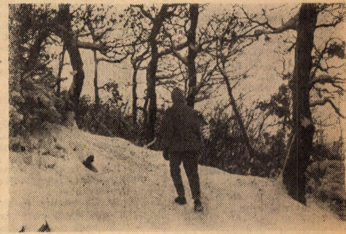
(Szökröm László felvétele)