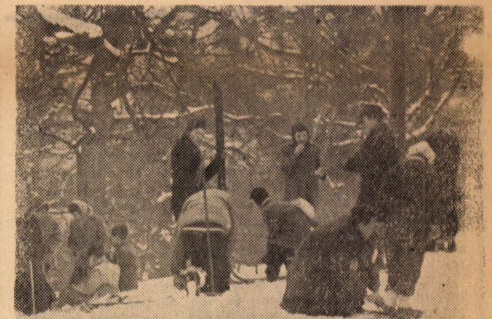
Nagy a vidámság a havas erdőben