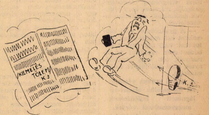
Ez is az, — az is az.