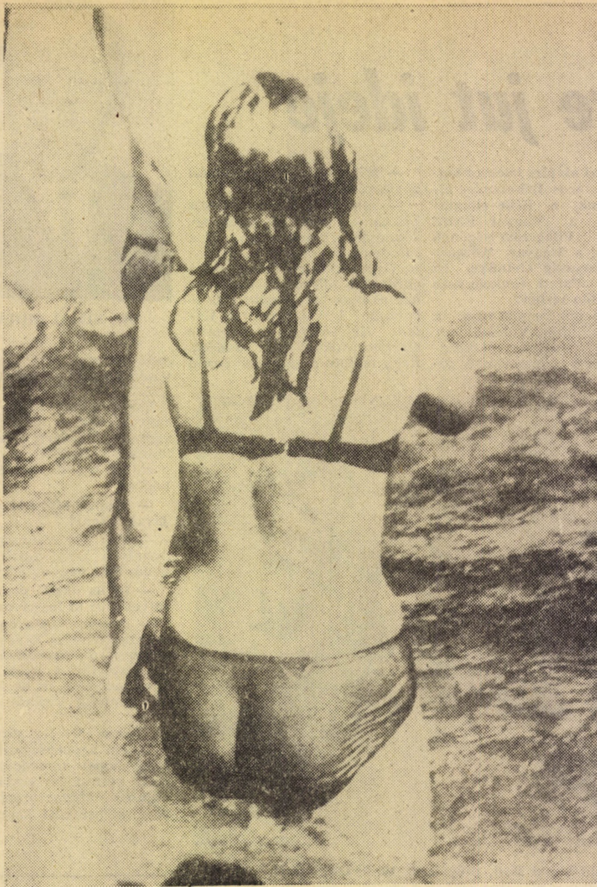
SZEPTEMBERBEN — MAJD JÖVÖK...