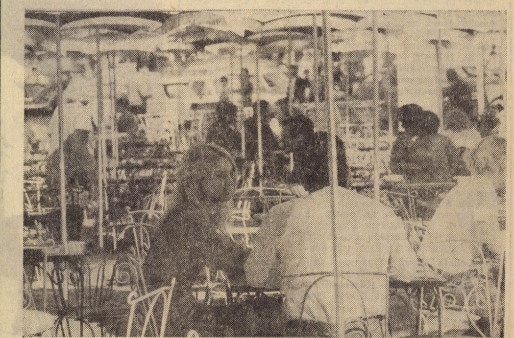
Fekete mellett a szökevel

V. Kotlynyikov akadémikus, az SZTA elnökhelyettese