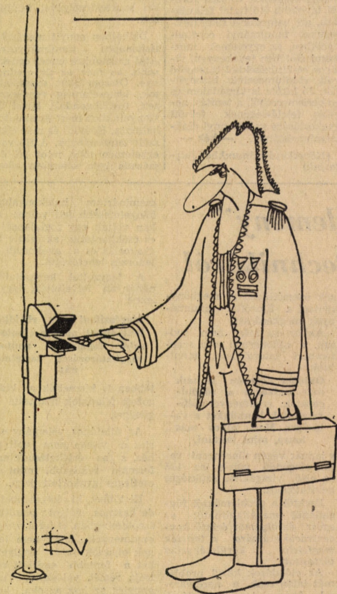
UTAZÓ NAGYKÖVET Benkő Viktor rajza