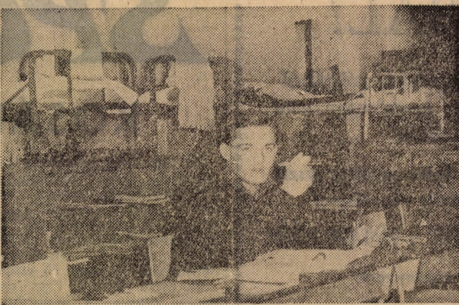
Akit a tanulásban zavartunk meg

Terjedelmes kaszárnyát találtam... A lépcsőházat viszont nem. Éjszakai sötétség, óriási méretek. Igyekeztem férfiasan viselkedni; bátran lépegettem egészen addig, amíg egy szaga után szeméthalmaznak vélt domb alakú gyalog-sági akadályon keresztül estem. Miután óvatosan feltá-páskodtam, egy ajtó körvona-