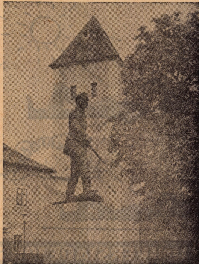
A fizikai dolgozók KISZ-alapszervezete május 22-23-án autóbussz-kirándulást szervezett Köszegre.

Hűvös, esős idő volt induláskor. Ezért maradt el a tervezett szombathelyi városnézés is. Másnap csak késéssel indulhattunk el, egy sajnálatos defekt miatt.