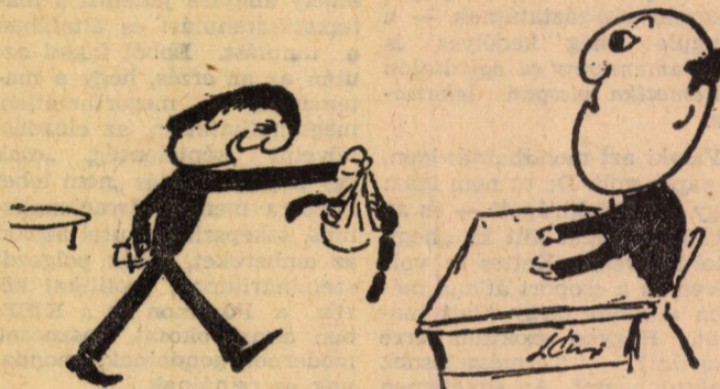
Amíg elkészül a vázlatom, tessék megkóstolni ezt a jó kis disznótortot