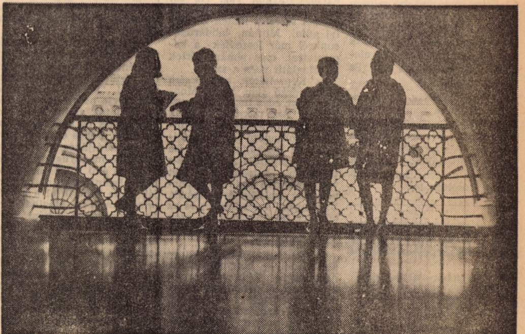
Az egyik legötletesebb, jól sikerült fotót Urbán Tamás készítette. De próbálna csak meg azt a felvételt mostanában megcsinálni!