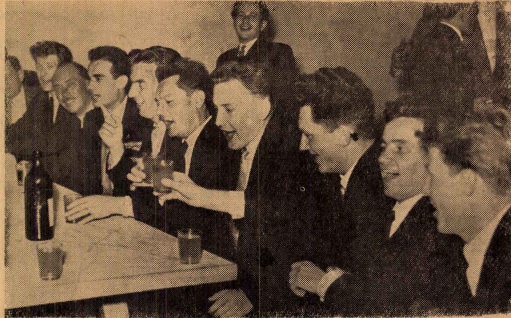
Gondold meg, és igyál!... (De azt is gondold meg, hogy mennyit!) (Krizsán János felv.)

„Mindenki számára emlékeztetés az a pillanat, amikor először lépte át az iskola küszöbét. De ugyanígy emlékeztetés marad az a pillanat is, amikor az ember búcsút mond az iskolának és ezzel az életútja küszöbét lépi át, életének új szakasza kezdődik” — kezdte Sásdi elvtárs a negyedévesek búcsúbankettjén Háy elvtárs beszédének felolvasását. Az I-es előadó zsűfőlétség megtelt közönséggel — végzett diákok és szülei, oktatók és egyéb meghívottak — érdeklődéssel hallgatták a rektor szavait.