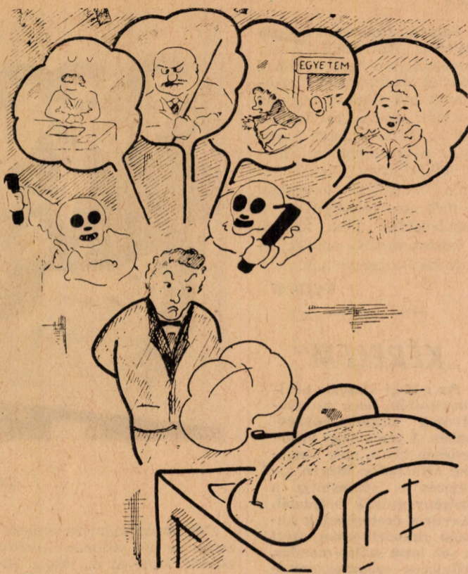
Vizsgáztató: Fiam, csak feleljen egészen nyugodtan.