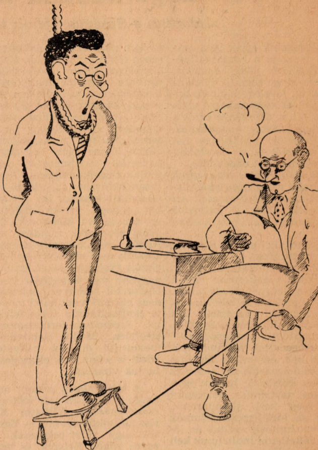
Elnök: Nos, feladom magának az utolsó m e n t ő k é r d é s t!