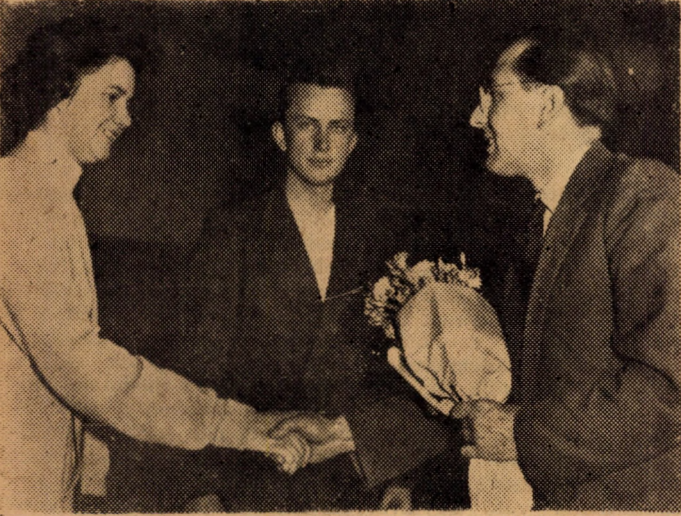
A hallgatók köszöntik az Agrárgazdaságtan Tanszék dolgozóit