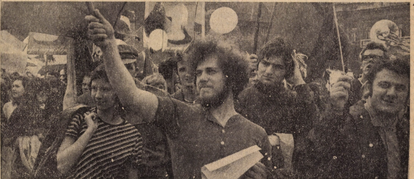
Egyetemisták a májusi kavalkádban.