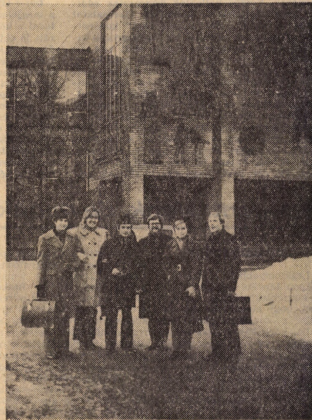
Még tél volt, amikor kint jártunk... (a KÖZGAZDÁSZ azonban krónikus helyhiánnyal küzd!)

Van „cum laude” szintnek megfelelő, rövid kurzus és bevezető kurzus. Az egyes szinteken más-más követelményrendszer a tananyag. Meghatározott kööttségek között a diákok maguk választ-