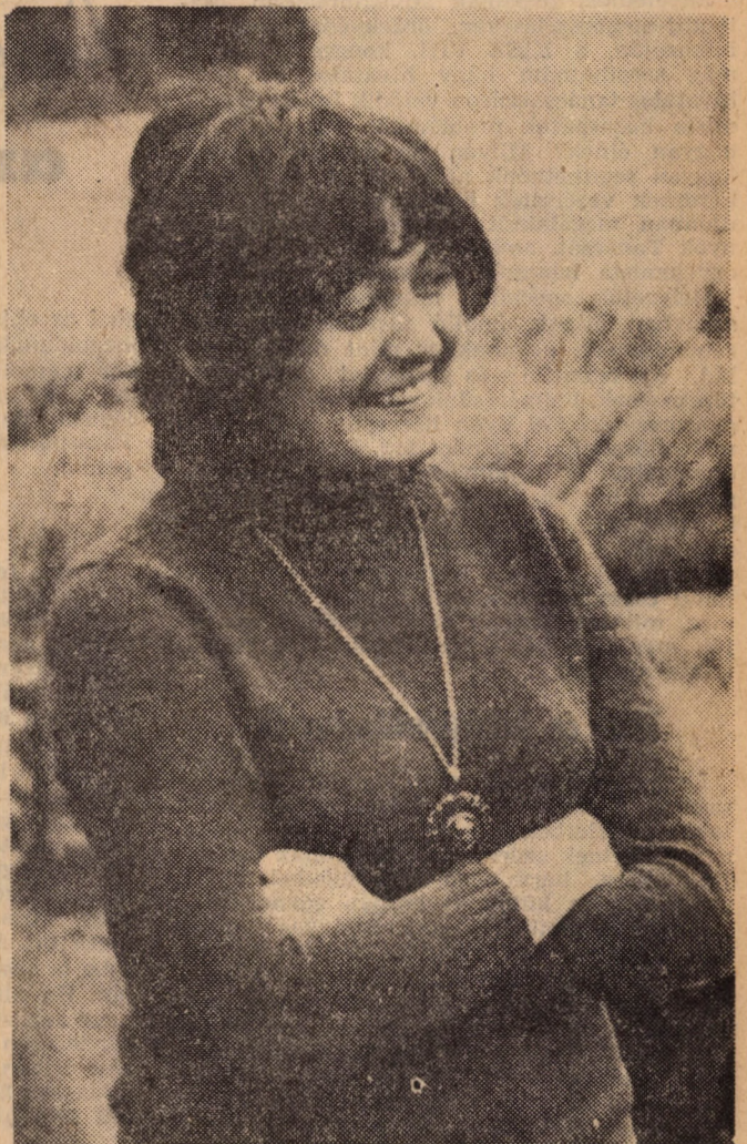
Hát úgy néz ki, mint, aki vendég?!