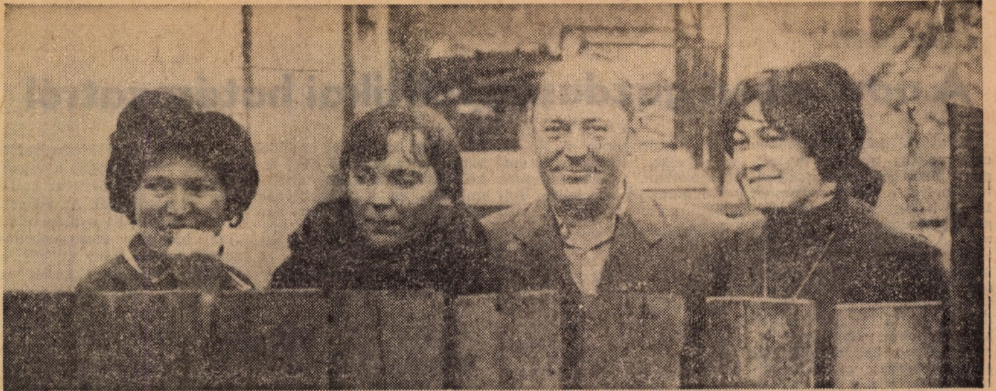
Együtt a család