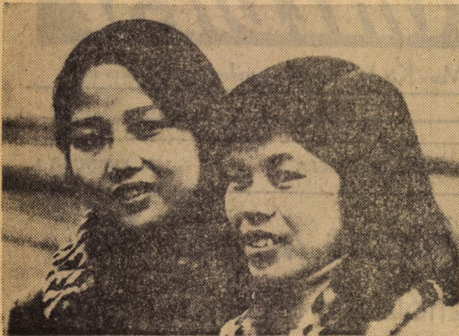
A két barátó