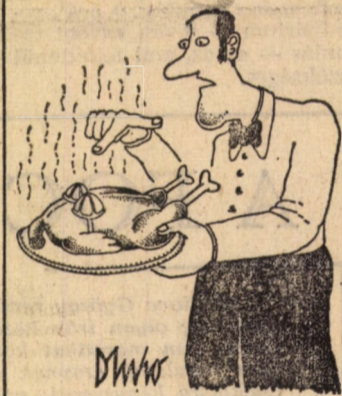
Dluhopolszky László rajza

A napokban megjelent egy ember az Országos Találmányi Hivatal elmeosztályán, és bejelentette, hogy feltalálta a lábat. A találmányt természetesen elutasították, a beteg viszont eljutatta hozzánk találmányának leírását, remélve, hogy mi felhívjuk rá a figyelmet. Sajnos, kedves leíróknak ez a reménye nem teljesülhet, mert a láb igen régi találmány. Mivel azonban tudományos mellékletünkhöz több száz levél érkezett, amelyben kéri, beszéljünk öszintén a lábról, mai lábujgyzetünkben igyekszünk összefoglalni a lábbal kapcsolatban lábrakapott különféle nézeteket.