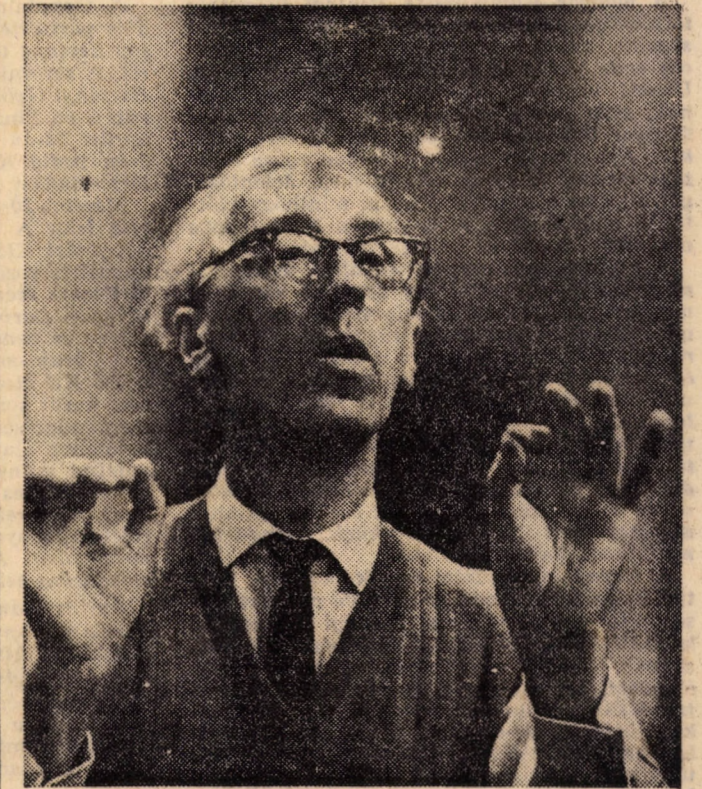
A Szovjetunió ma fotókiállítás anyagából