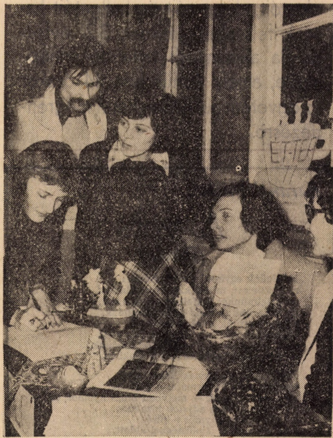
Sokan jelentkeztek az építőtáborba az elmúlt héten

Tőlünk viszont elvárják, hogy csúcsidezszakban kicsit