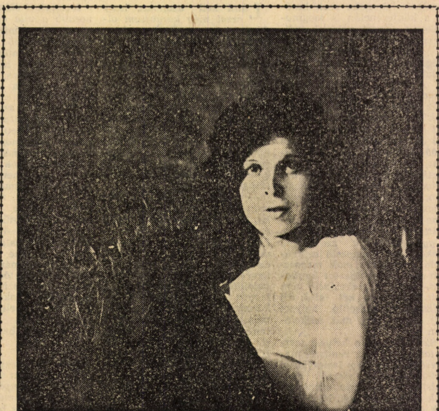
Nyári kép