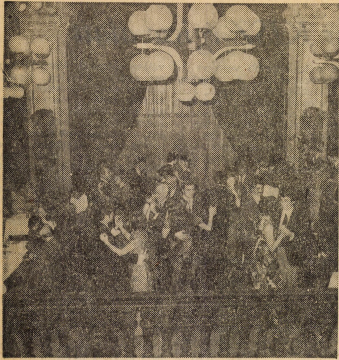
Bál a Hungáriában