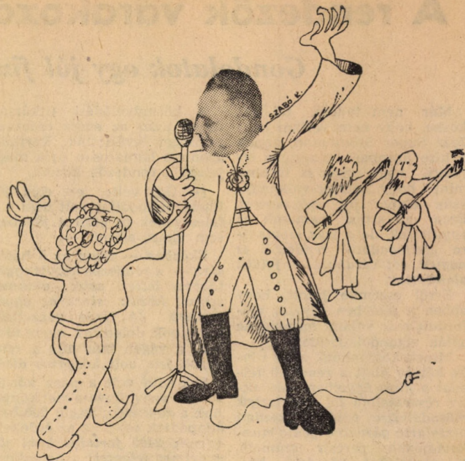
„Oda vagyok magáért”