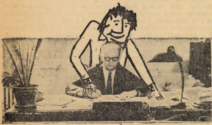
Ahogy a diák szeretné az ifjúsági parlament után