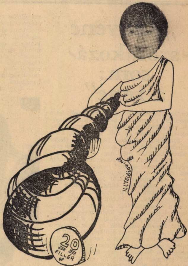
Ev végére nem maradt benne egy lyukas húsz fillér sem

kiderült, hogy nemcsak a szavolt vasárnap délelőtt az aula. Egyetemünkön dolgozó fiatal szülők hozták el csemétéiket a kultúrósztály által szervezett gyerekműsorra. Rövid táncbemutató után versek, mesék szórakoztatták a gyerekeket. Közben egy-egy dalt együtt énekeltek az irodalmi színpad tagjaival. Ezek után egy zenés bábjáték következett. A legnagyobb figyelem persze a Mikulást övezte, akiről