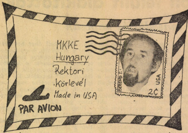
Unenpi (Be) rendelet az USA-ból