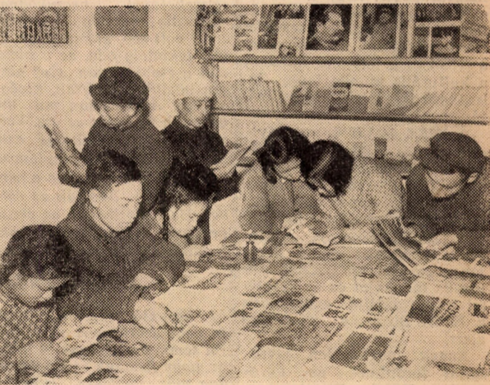
Az egész nép tanul