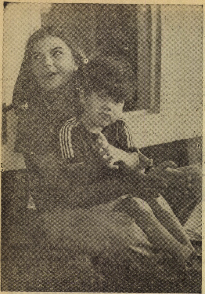
Tapsi, tapsi mamának