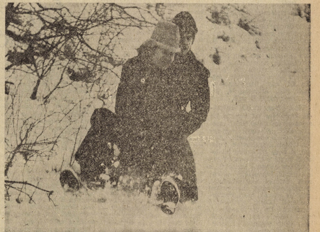
Fut a szánkó