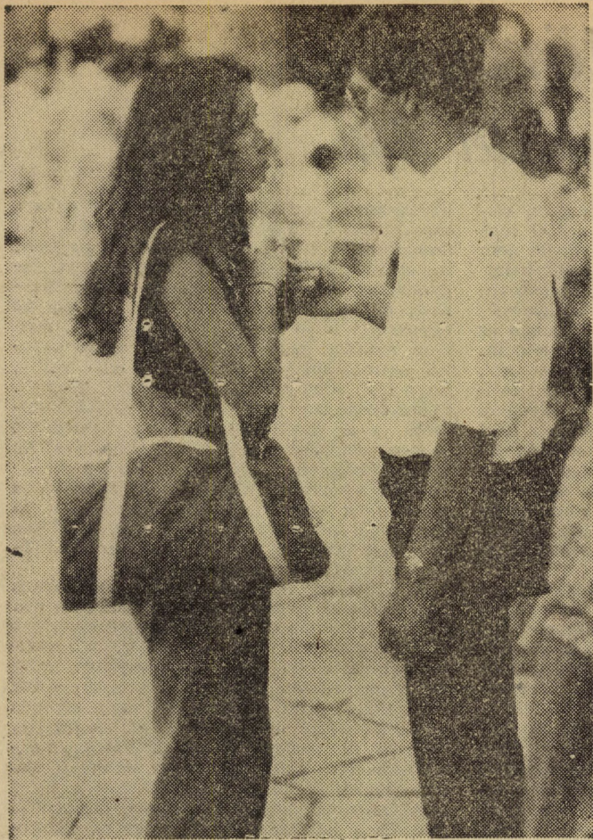
Te engemet, én tégedet...