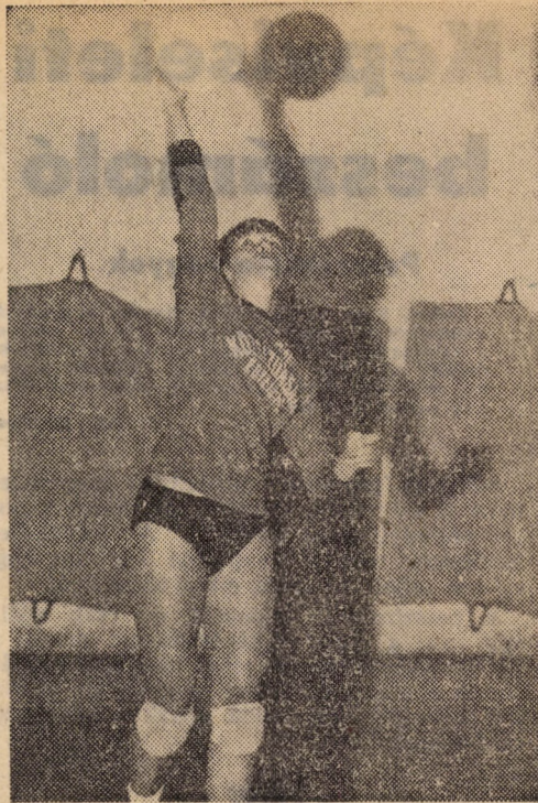
A röplabdaspot szépségei