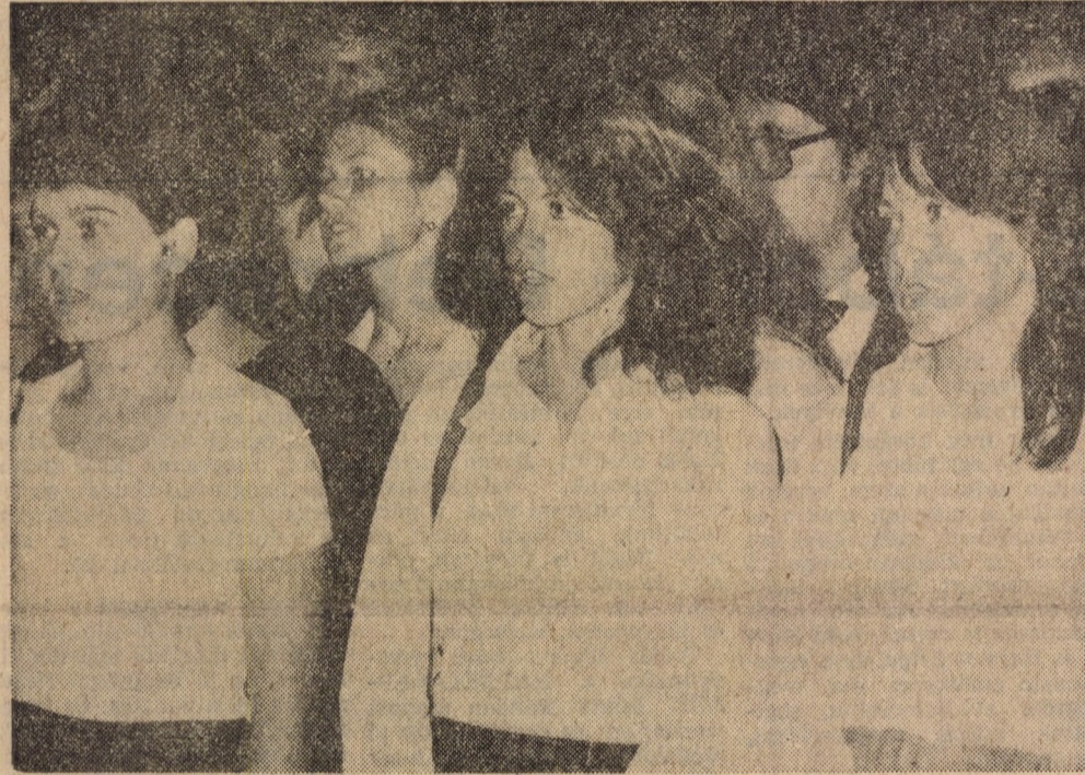
Az elsőévesek fogadalomtéttele