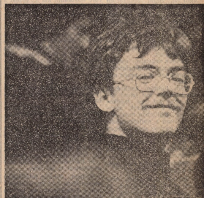
Fotó: Balázs Gusztáv