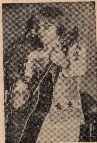
ezek a mai fiatalok! A kérdés-feltevők emlékezetes öngólt rúgtak.

Diadalútján azért haladhatott könnyörtelenül ez a zenei irányzat, mert sokan támadták. Ilyen közegben élesebb az elszántság, jobb a haladás, mint egy felhígultban. A hatvanas években nem az volt a kérdés, hogy mikor lesz magyar világsztár, hanem úgy-mond az, hogy melyik stílus szolgálja jobban a nemzeti hagyományokat. Burkoltan az, hogy nyugatimádó huligánok