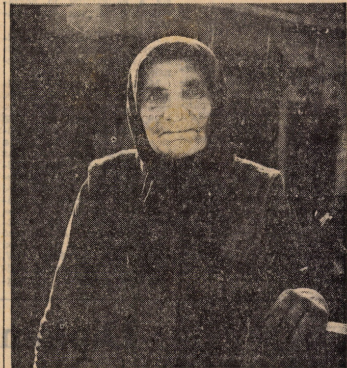
Rég elmúltam 60 éves ...