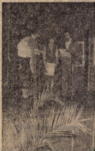
Az ünnepi műsor szereplői

Fehér asztal mellett vidám mulatság követte a műsort. Volt itt jókedv, hangulat, zene, ének, tánc, természetesen koccintás is, de tanár aktivistáink — mindenre felkészülve — tovább szórakoztatták a