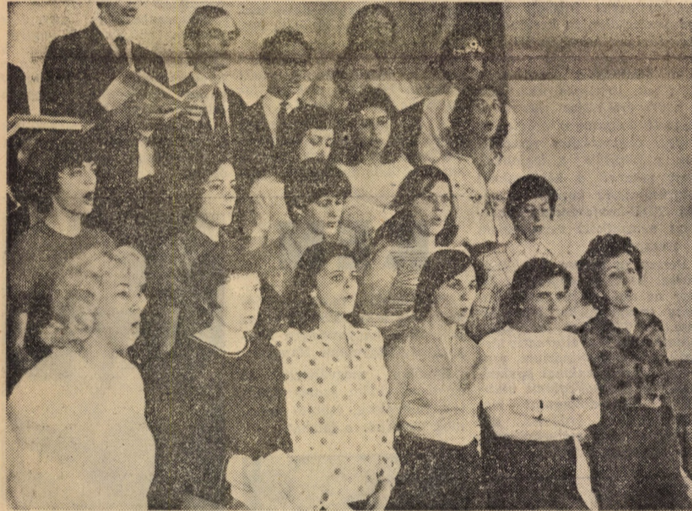
A világhírű Chorus Oeconomicus

A testnevelési tanszék munkatársai szeretettel segítenek minden sportolni vágyó hallgatónak.