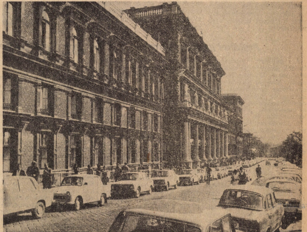
Nézd meg belülről is!