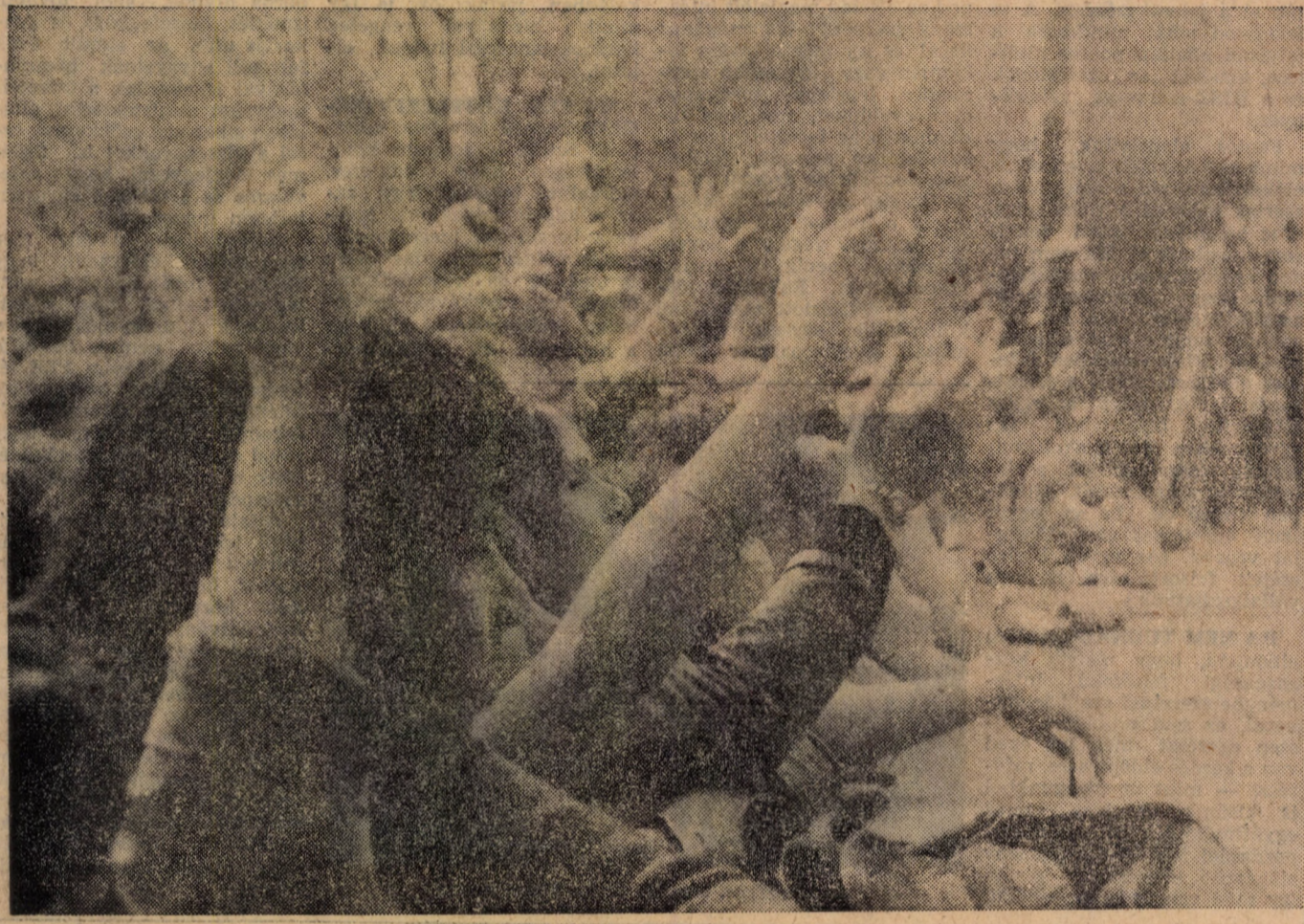
En is, én is!

XXIII. ÉVFOLYAM 12. SZÁM FELVÉTELI ELŐKÉSZÍTŐ BIZOTTSÁG KÜLÖN SZÁMA 1981. AUGUSZTUS 20.