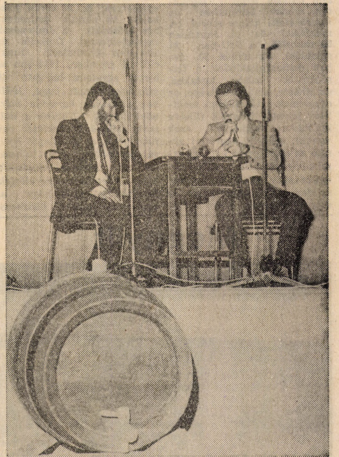
Csapraütés előtt — tart a műsor

ha tudsz tömeggel szólni, s él erényed, királlyal is — és nem fog el zavar, ha ellenség se, hű barát se sérthet, ha szíved mástól sokat nem akar; ha bánni tudsz a könyörtelen perccel: megtőlöd s mindig méltó sodra van; tiéd a föld, a száraz és a tenger, és — ami még több — ember lész fiam!