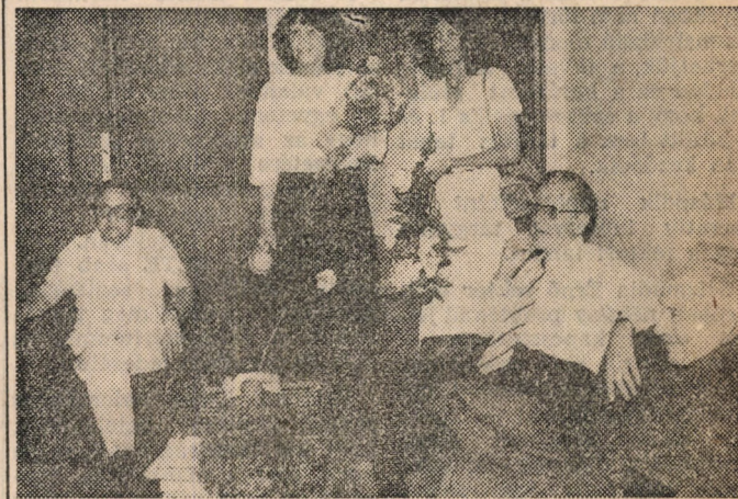
Az agrár tanszéken

„Most, hogy végzős lettem lassan el kell mennem. Búcsút mondok nektek, kiket itt szerettem. Hogy is lennék boldog, mikor véget értek a boldog diákévek, már múlt emlékek.”