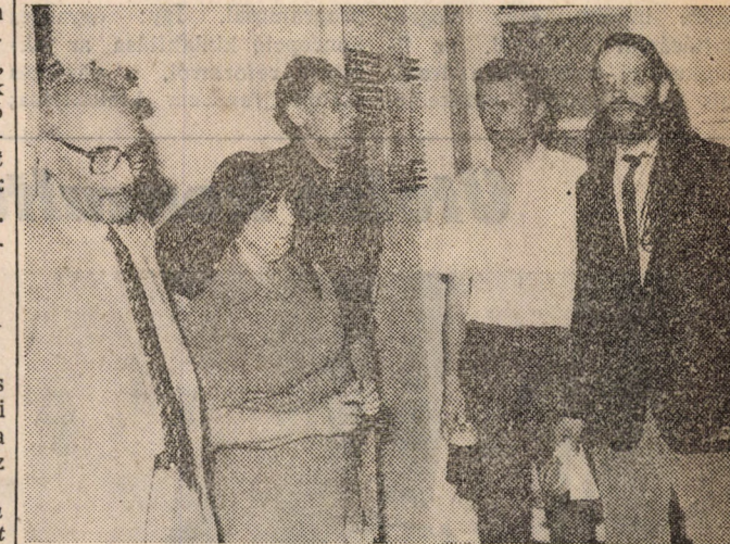
A belker. tanszék előtt