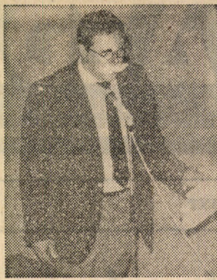
A legdiákbabb tanár

tuk az 1 Ft-os bélyegeket, a 25 Ft-ost, a borítékokat, az igazolókat rendszeren — in-derünk mindezt igazolja!