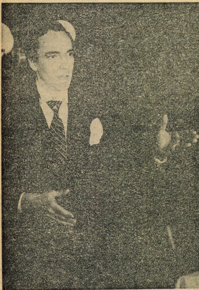
Benedek Miklós

Nagy Endre a grófhhoz, 1907-ben: „En itt iparkodom valami újat, valami mást csinálni, hogy a magyar írók és művészek annyi fizetést kapjanak, hogy megmaradjon a kedvük a művészetükhöz. És a gróf úr rablásnak nevezi, mert harminc koronát kérünk egy öt-személyes páholyért, amelyben kettedmagával akar ülni. Látom, hogy ezt a kabarét nem a gróf úr számára csináltuk.” „Na ja, az ember társas lény, az tény!”